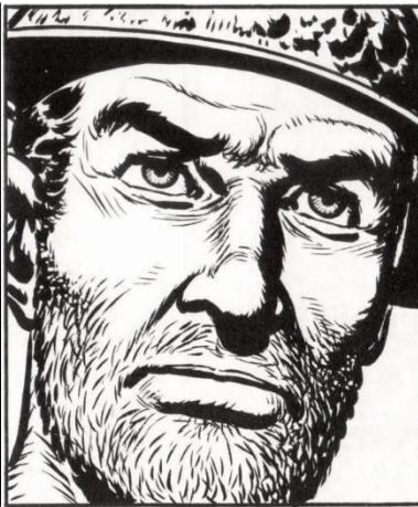
Ο μόνος πόλεμος που αξίζει είναι ο ταξικός!