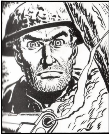
-Τελικά, είχε δίκιο η Τζούλια!

Για να ξαναπάρει η δυναμική των προλεταριακών διεκδικήσεων ξανά τα πάνω της, θα χρειαστεί να μπει στην ημερήσια διάταξη το ζήτημα της στρατηγικής, της ενοποίησης των αγώνων γύρω από τον μισθό, την απαλλοτρίωση όσων παράγουμε και την επανοικειοποίηση του χώρου και του χρόνου από το κεφάλαιο. Οι διεκδικήσεις θα πρέπει να ξεφύγουν από το μίζερο πλαίσιο της τελευταίας δεκ αετίας και στη γενικευμένη αύξηση των τιμών και συρρίκνωσης της πραγματικής ζωής να αντιτάξουμε τον πληθωρισμό των δικών μας αναγκών και επιθυμιών - έξω και ενάντια σε κράτος και κεφάλαιο.