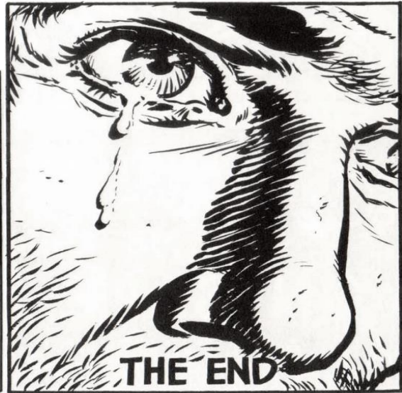
Τόσα χρόνια σπαταλημένα στις λάθος μάχες, στο λάθος μέτωπο...